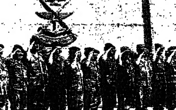
الضباط يؤدون التحية العسكرية